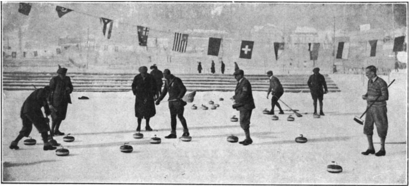
Le Rink du Stade Olympique du Mont Blanc pendant le tournoi