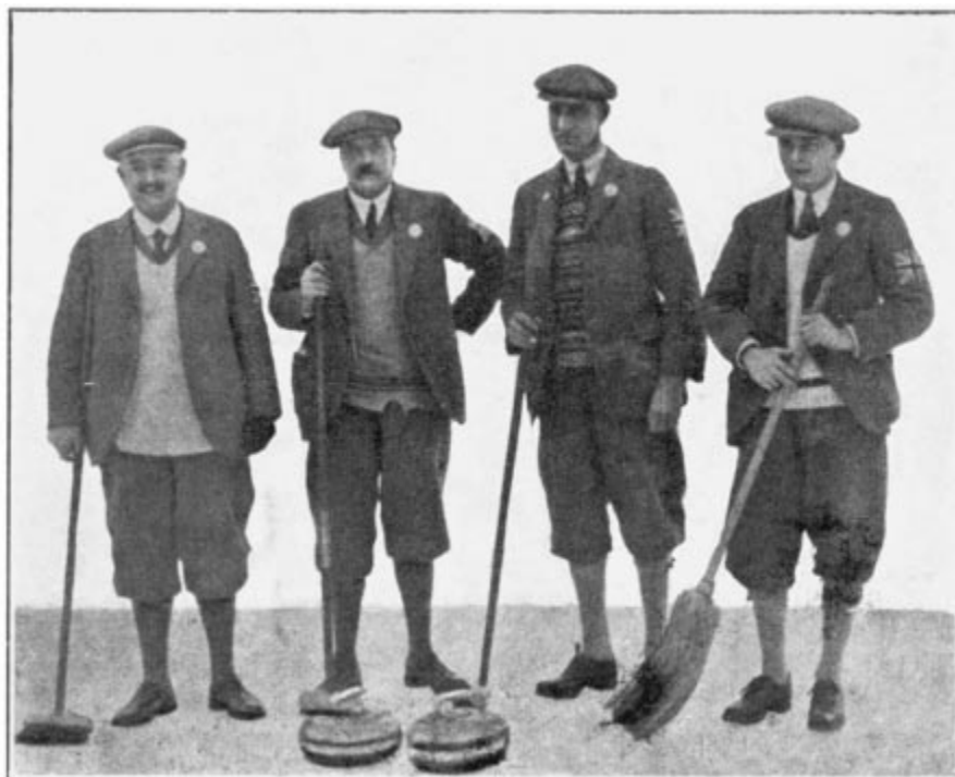
L'équipe de Grande-Bretagne

Ce premier tournoi de curling, sans remporter naturellement un bien grand succès spectaculaire, eut, toutefois, pour résultante de lancer en France cet attrayant sport, qui était jusqu'alors complètement inconnu.