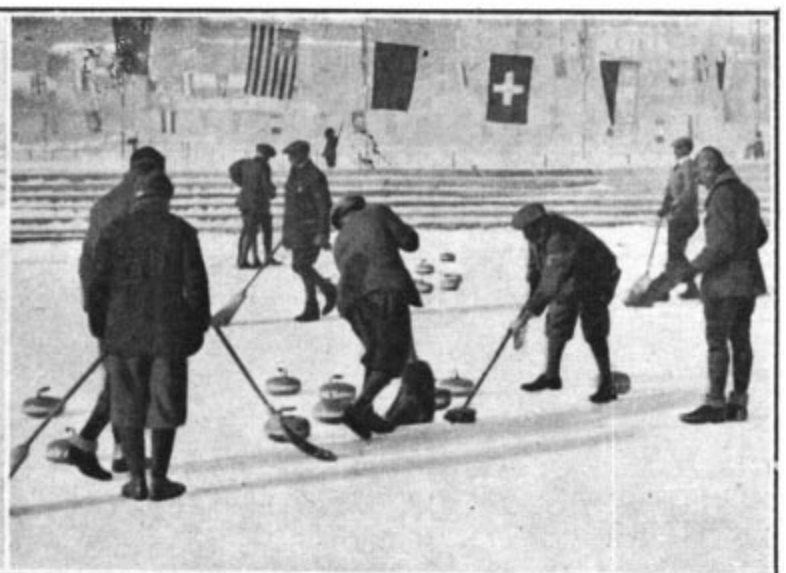
Un point disputé au cours du match France-Grande-Bretagne