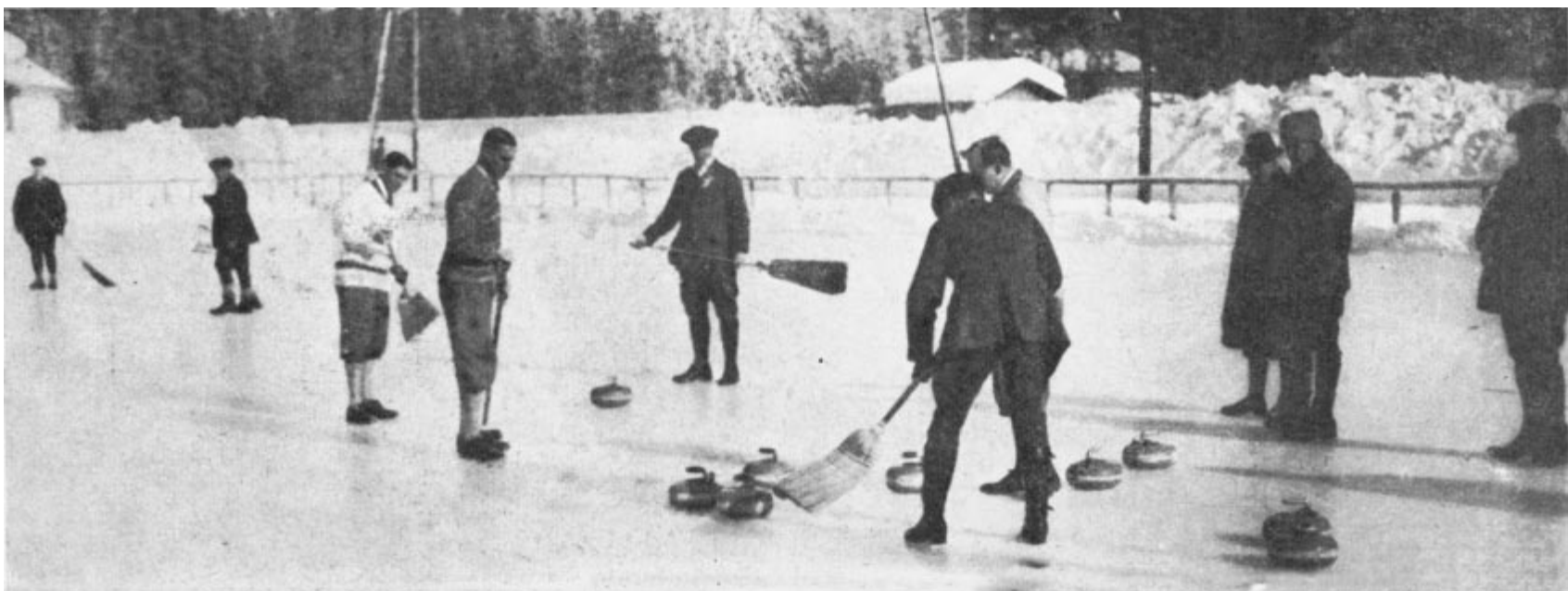
Le match décisif entre la Suède et la Grande-Bretagne