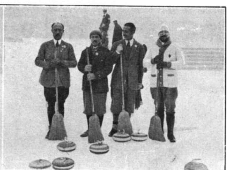
L'équipe de France, classée troisième