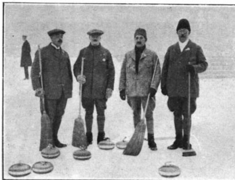
L'équipe de Suède, classée deuxième