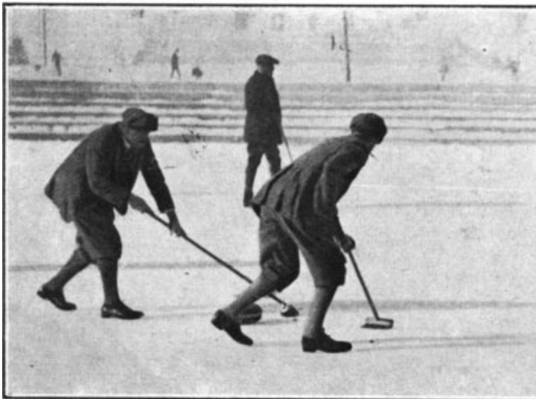
Pendant le match Suède-Grande-Bretagne